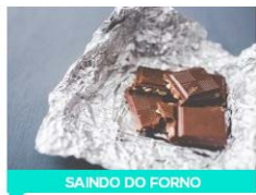
SAINDO DO FORNO